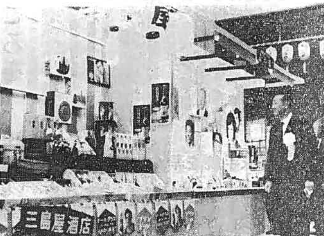
トップ商品がずらり、連日好評のうちに幕をとざした振興展

総合診断はまず予備調査 と歩調をあわせ、経営活動 じ組織的にこなわなければ ならない。それは木町 通りなど五方面の商店街配 と—吉原市は南地区で、一 から四丁目を寫真にま で、県中小企業指導所とタ イアップして、四月から三 カ月間、不燃化建築商店街 行きの調査、消費者の声を 取り、東本通り、西 本通り、和山町通り等の 約三五〇店の総合診断をお こないました。 常活動水準のレベルアップ 町通り以外に副都心商店街 を造ること—吉原市は総 合工都建設にともない、来 容の増加が、今後ますます 増加すると思われるので、 大和町、和山町などは本町 通りと性格のちがう、庶民 的な核(中心街)をつくり 副都心的に発展していくこ とが必要である。