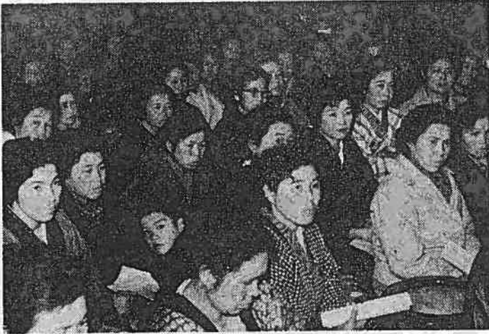
婦人とガンの話しにききいるお母さんたち

子どもたちにとつてもっとも大切な三学期もあつたところあと二十日たらずまでです。 この春休みは、一年間の学習を終り、宿題からも開放されるなどにもとつてたのしい休みであるともいふ一面危険なことも忘れてはなりません。 なかでも最終学年のことにもとつては、進学や就職の問題に直面してゐますので、精神的な負担が重く、また動揺しやすくなつてゐます。こういうときは、子どもの立場になつて、よき相談相手となり、むりな要求をしないで優しく接してあげてほしいと願つてゐます。