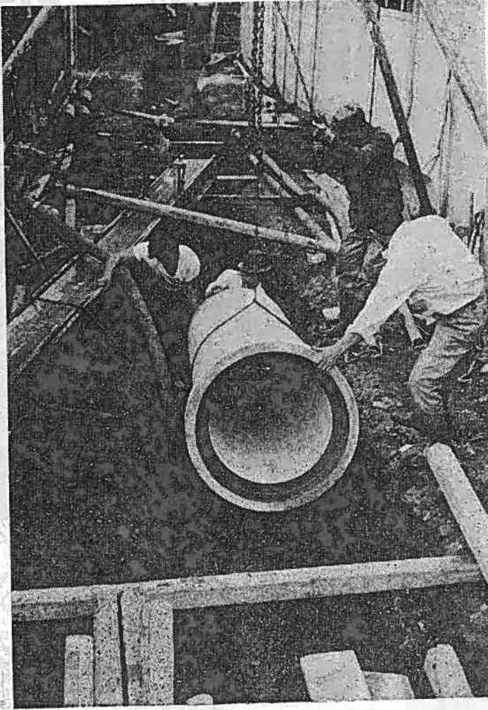
急ピッチで進められる下水道の埋管工事

埋管される5線12キロは、和川を境界線にして北側を北部排水区、南側を南部排水区と名づけ、四十年の完工をめざし急ピッチで行なわれています。