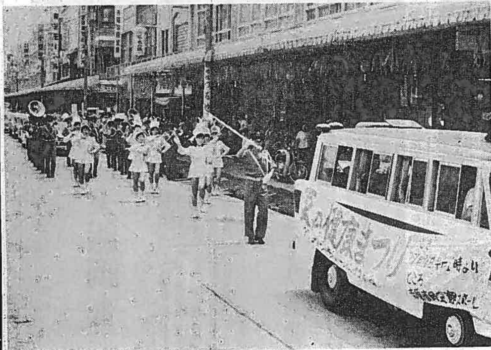
夏の健康を守ろう...スローガンを掲げ、市民に呼びかけをする一行