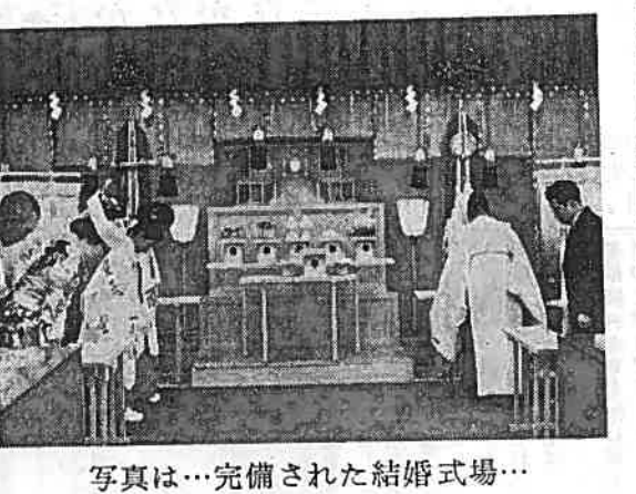
写真は…完備された結婚式場…

午前の場合、一三六六円、午後の場合、一四三三円と定めており、ご希望があれば、列席人員に合わせた別室でも、披露宴を行うこともできます。経費は、使用室と使用器具に要する料金を七〇〇円から二五〇〇円程