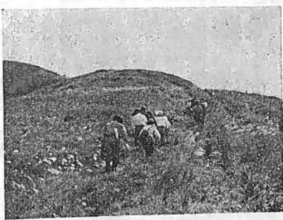
越前岳を目指して

く、日光の直射を浴びて登る尾根続きの急坂にもあまり疲れもみせない。愛鷹特有の冷気を感ずる原始林、めづらしい高山植物や、背丈以上もある熊笹の茂みのなかを予定通りの成果を挙げて帰りました。 小児マヒなどで体が不自由になっている人、眼がみえない人、または、視力がだんだんなくなる人、 ●耳が聞こえない人、または、耳が聞こえない人、また、口がきかぬ人、 ●口がきかぬ人、また、口がきかぬ人、 ●身体障害者や戦傷病者のうちで、更生医療の給付、補装具の給付、また