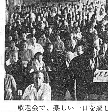
敬老会で、楽しい一日を過ごしたお年寄り