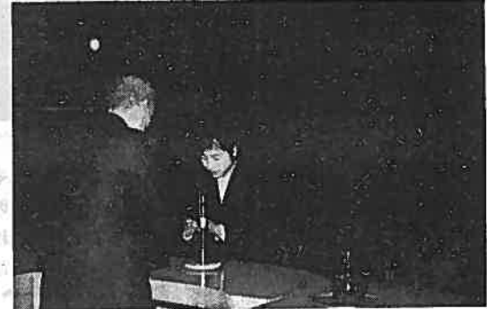
(写真・全員が洋服姿で参加した成人式)