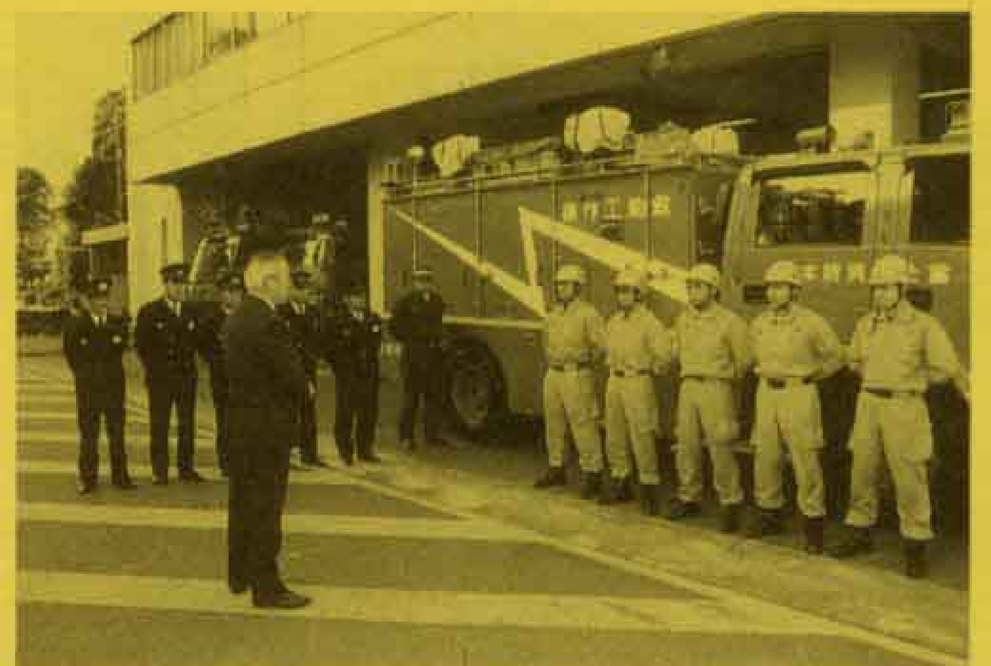
↑市長の激励を受け、出発する消防特別救助隊