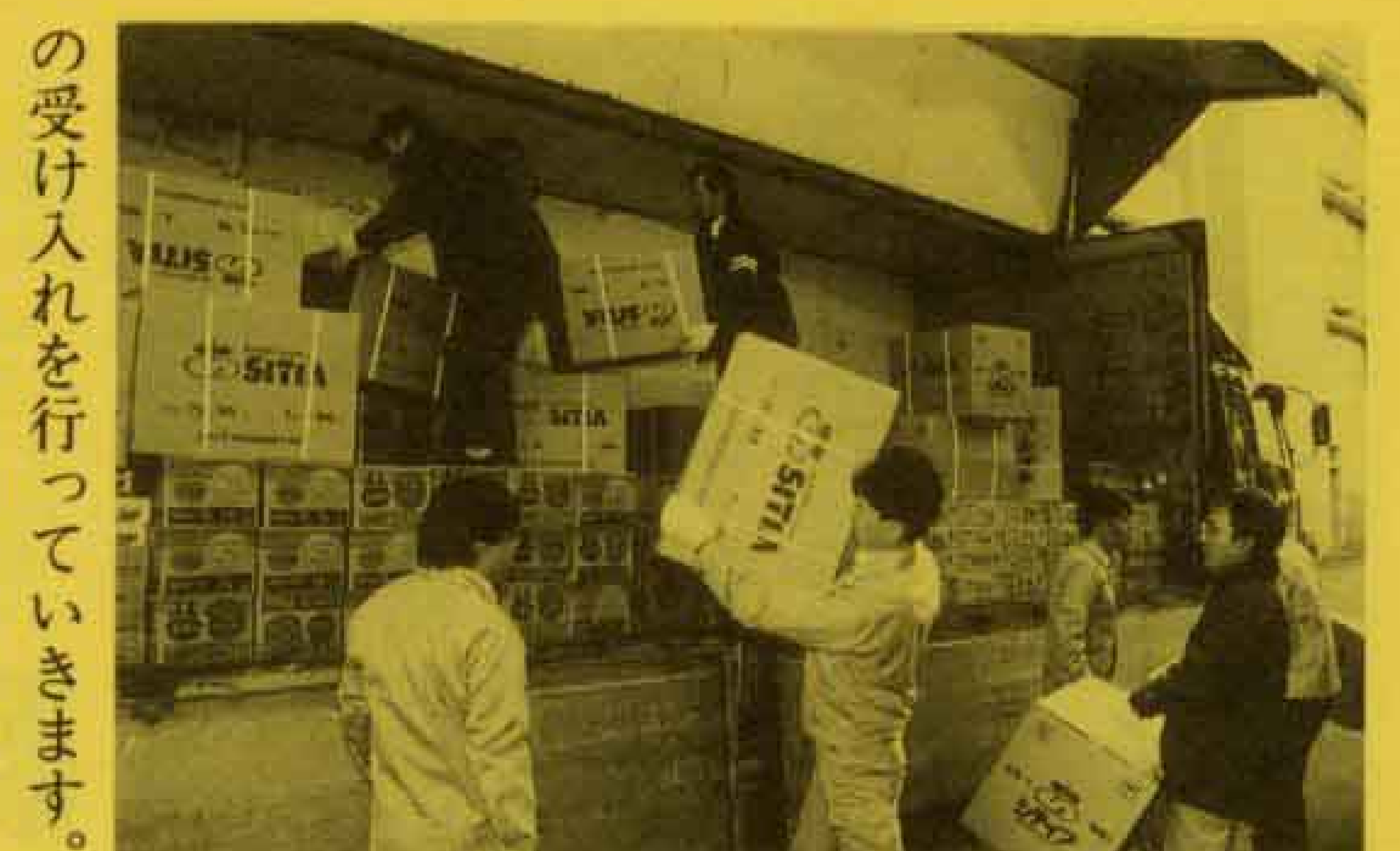
↑富士県行政センターで援助物資をトラックへ搬入