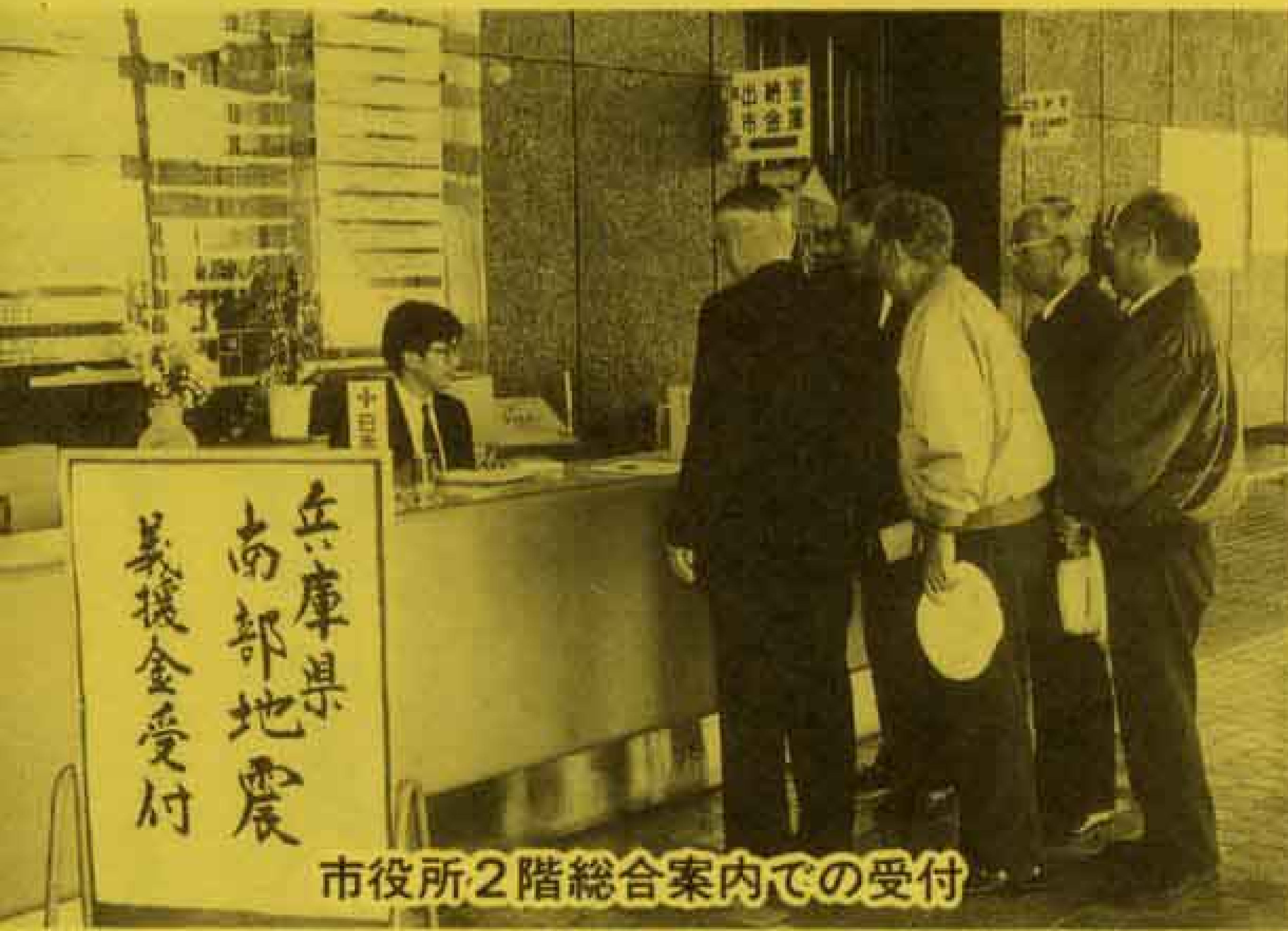
市役所2階総合案内での受付

多くの市民や団体などから、一月二十七日現在で、千百件余り、約五千二百万円の金額が届けられました。この義援金は、日赤静岡県支部を通して、兵庫県に送られます。