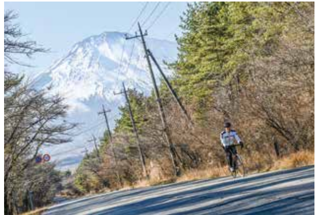
▲雄大な富士山を眺めながらサイクリング

市内にはサイクリストの休憩スポットやサイクルピットが設置されています。四季を通して楽しめる富士山を眺めながら、サイクリングをしてみませんか？