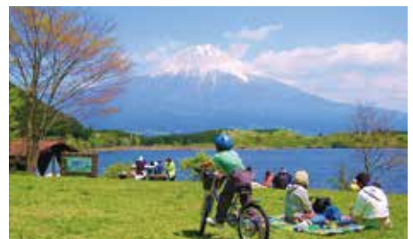
▲春は桜、秋は紅葉で多くの人でにぎわう田貫湖