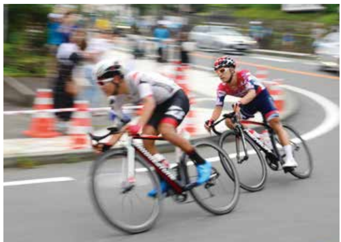
▲7月に開催されたREADY STEADY TOKYO 自転車競技ロード