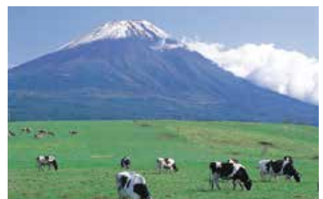
▲雄大な富士山が裾野から頂上まで眺められます

湖畔には、キャンプ場や自然体験施設、湖を一周することができるサイクリングロードが整い、富士山の絶景が楽しめます。また、春と夏には早朝の時間限定で、富士山頂から太陽が昇る神秘的な光景の「ダイヤモンド富士」を見ることができるところとして有名です。