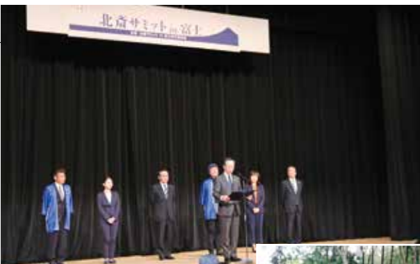
▲関係自治体・団体などが相互交流と協力を誓った共同宣言