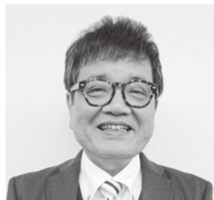
もりなが たくろう 森永 卓郎 獨協大学教授、経済アナリスト