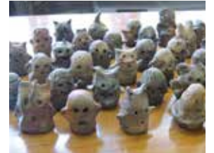
ミニミニはにわ作りより 「体験作品」