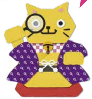
▲プレミアム付商品券キャラクターカクニャン

10月1日に予定されている消費税・地方消費税の引き上げが家計に与える影響を緩和するとともに、地域の消費を下支えするために、 A 住民税非課税の人と B 乳児・小さな幼児のいる子育て世帯を対象にした富士市プレミアム付商品券を発行します。