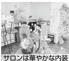
サロンは華やかな内装

これまで、自宅で「プリザーブドフラワー」のフラワーアレンジメントを教えていました。でも、会場が自宅だと、作品見学などが難しいので、商店街にサロンをオープンしました。サロンではレッスンや、リースづくりなどの活動をしています。プリザーブドフラワーは何年も楽しめます。 主婦による出店は大変ですが、この事業では初期投資から確定申告まで支援していただきました。このサロンが「彩り」になって地域が華やぐとうれしいですね。