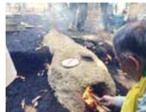
「古代料理レストラン」から 古代の釜戸