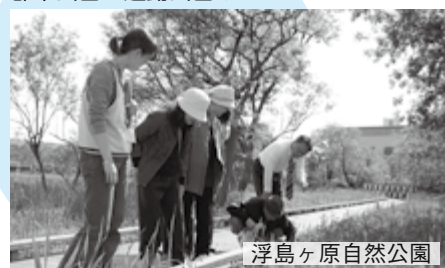
浮島ヶ原自然公園