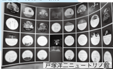
戸塚洋二ニュートリノ館