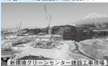
新環境クリーンセンター建設工事現場