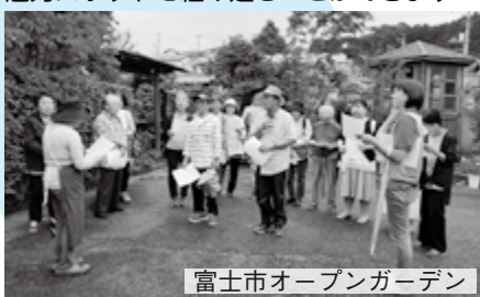
富士市オープンガーデン