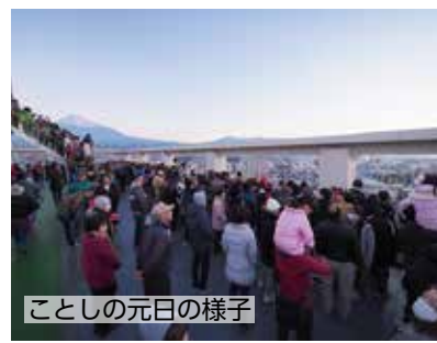
ことしの元日の様子