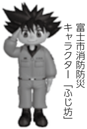
富士市消防防災 キャラクター「ふじ坊」

■住宅用火災警報器を設置しましょう 住宅用火災警報器は、富士市火災予防条例で、全ての住宅の寝室と階段（寝室が1階以外にある場合）に設置が義務づけられています。 ■住宅用火災警報器を点検しましょう 火災時にきちんと作動するように、定期的に警報音の確認をしましょう。テストボタンを押す、またはひもを引くことで確認ができます。 ■10年を目安に本体交換をお勧めします 古くなると電子部品の故障や電池切れなどにより、火災を感じしなくなることがあります。