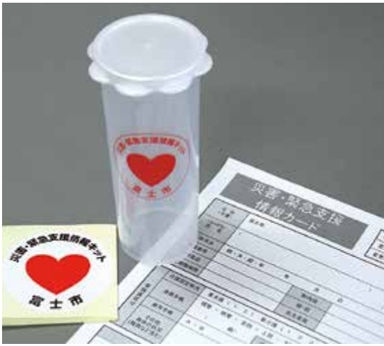
災害・緊急支援情報キット(左から、冷蔵庫・玄関用ステッカー、保管容器、災害・緊急支援情報カード)

体の状態や、かかりつけの医療機関、服薬情報、緊急連絡先などを記入した災害・緊急支援情報カード(左写真)のほか、保険証のコピーなどを災害支援キットの中に入れて保管します。