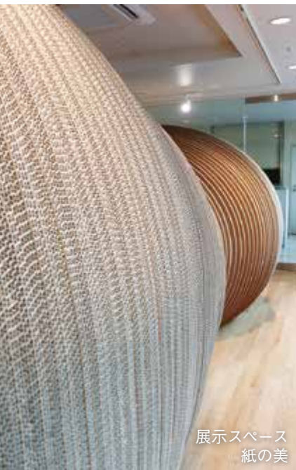
展示スペース 紙の美

展示スペースでは、年3・4回、企画展を開催。交流スペースは、紙を素材にしたアート作品を常設展示するほか、ワークショップの会場として活用するなど、情報交換・交流の場となっている。