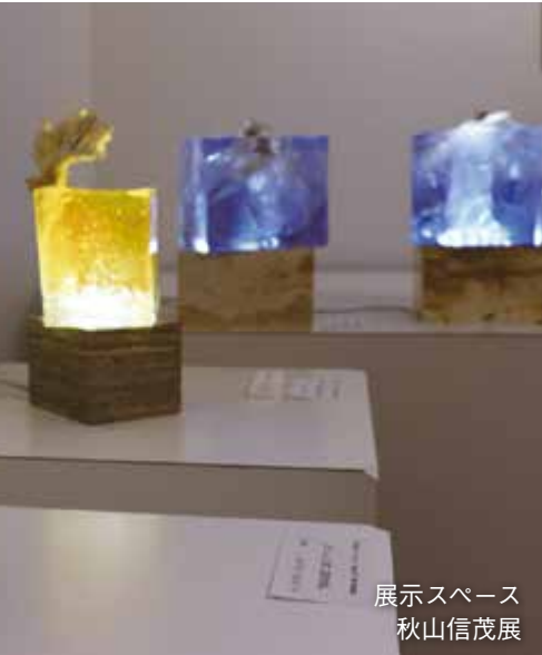
展示スペース 秋山信茂展

ふじ・紙のアートミュージアムは、産業としての紙に加え、芸術・文化の面からも「日本一の紙のまち 富士市」をPRするため、紙のアートに特化した全国初のミュージアムとして開館しました。オープンから1年半、市が誇る「紙」の魅力や可能性を直接感じてみませんか。