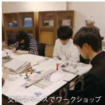
交流スペースでワークショップ