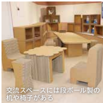
交流スペースには段ボール製の机や椅子がある

展示スペースでは、年3・4回、企画展を開催。交流スペースは、紙を素材にしたアート作品を常設展示するほか、ワークショップの会場として活用するなど、情報交換・交流の場となっている。