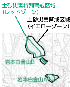
土砂災害の危険区域を確認しておきましょう

問い合わせ 防災危機管理課 ☎55-2715 FAX51-2040 E bousai@div.city.fuji.shizuoka.jp