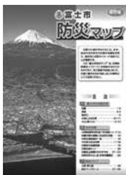
富士市防災マップ

市内には、土砂災害の危険区域が231か所存在します。皆さんの自宅周辺に存在する土砂災害の危険区域を「富士市防災マップ」（平成26年4月以降、転入世帯を含む全世帯配布）や「ふじタウンマップ」（市ウェブサイトに「くらしと市政」トップページ右下）で確認しておきましょう。「富士市防災マップ」は、市ウェブサイトでも閲覧できます。「市ウェブサイト」くらしと市政→防災・安全安心→防災→災害への備え→防災マップについて