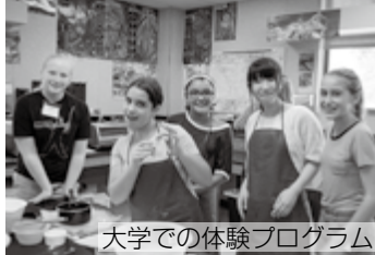
大学での体験プログラム