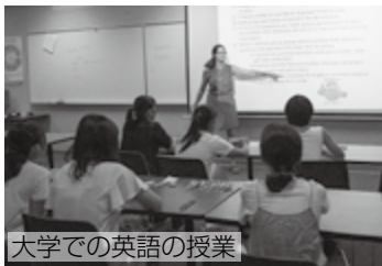
大学での英語の授業

詳しくは、チラシ(各地区まちづくりセンターで配布)または市ウェブサイトをご覧ください。