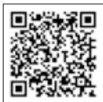
▲二次元バーコードも利用可

https://fujisan-seisyun.com (利用料無料。別途通信料がかかります)