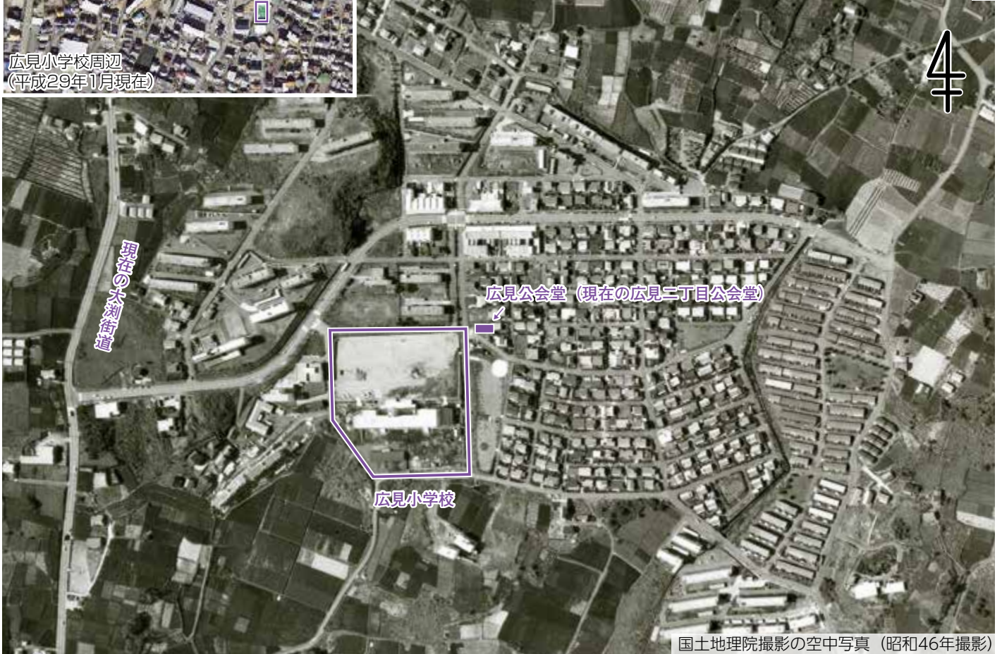
空中写真 (昭和46年撮影)