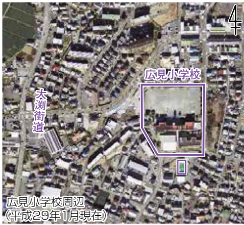
広見小学校周辺 (平成29年1月現在)