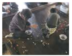
「農家の食と年中行事」からまゆ玉作りと小豆粥