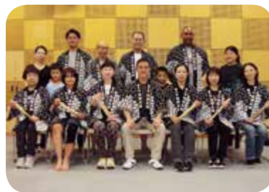
国久保熊野太鼓 保存会

地域文化の振興に貢献されています。地元の神社の祭典のほか、市内各地で演奏を披露するなど、積極的に活動されています。伝統芸能である和太鼓のすばらしさを幅広い世代の人々に伝えるため、活動を展開されており、今後も、活躍が大いに期待されます。