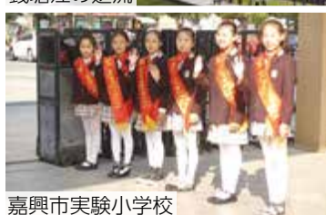
嘉興市実験小学校