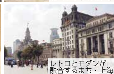
レトロとモダンが融合するまち・上海

詳しくは、チラシ(国際交流室、各地区まちづくりセンターで配布)または市ウェブサイトをごらんください。