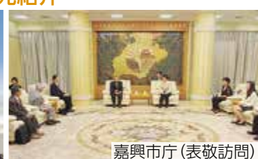
嘉興市庁(表敬訪問)