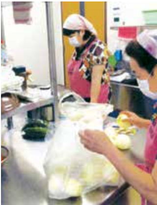
▲更生保護施設での食事づくり

●保護司会 罪を犯した人や非行をした人の生活を見守り、立ち直りを地域で支える民間のボランティア団体です。 ●更生保護女性会 女性の立場から、地域における犯罪予防の活動や、子どもたちの健全育成のための子育て支援活動などを行うボランティア団体です。