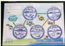
▲スタンプラリーシート