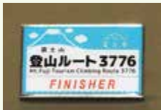
▲チャレンジ達成バッジ

③ シートに、山頂での記念写真を添付（写真は返却不可）し、富士山・観光課へ郵送（写真のみEメールでも可）し、チャレンジ達成バッジをゲット！