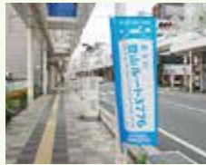
▲サポーターフラッグ

挑戦者が市内を歩いているときに、道案内をしたり、挨拶・励ましの言葉をかけたりするなど、日常生活の中で、できる範囲でサポートをするものです。サポーターの中で希望する人には、サポーターフラッグをお配りします。店舗やご自宅に掲示するなどして応援をお願いします。