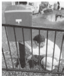
▲新設のポスト（吉永北）