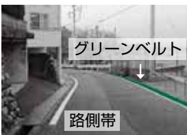
▲改善後の道路（今泉）

歩行者を保護するため、道路にグリーンベルトを引き直し、その反対側の車線に路側帯が設置されました。