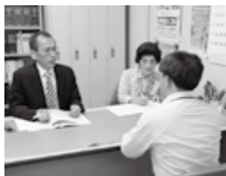
▲市民相談室（市役所3階市民安全課内）