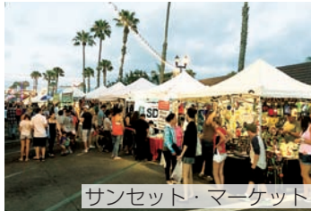
サンセット・マーケット