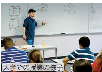
大学での授業の様子

詳しくは、各地区まちづくりセンターで配布のチラシ、または市ウェブサイトをご覧ください。