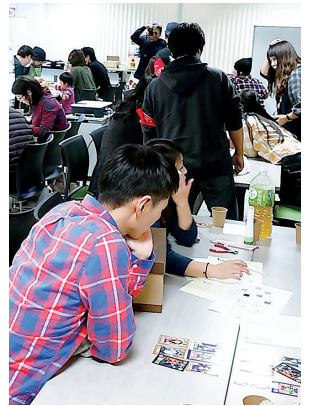
謎解きイベントで、和気あい あいと課題に取り組む参加者

「今後は各種団体と連携したユニーク なイベントを展開し、人と人、人とま ちなど、あらゆるご縁結びと地域活性 化を目的に活動していきたいです」と 話してくれました。 皆さんも、すてきな「ご縁」を求め て参加してみませんか。 問い合わせ/富士山縁結び研究会倉本方 ☎090(7034)5744