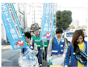
清掃活動における啓発

事業で啓発する ことや、市内の 効果的な場所に 大型看板などを 設置することも 検討しています。