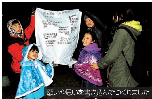
願いや思いを書き込んでつくりました