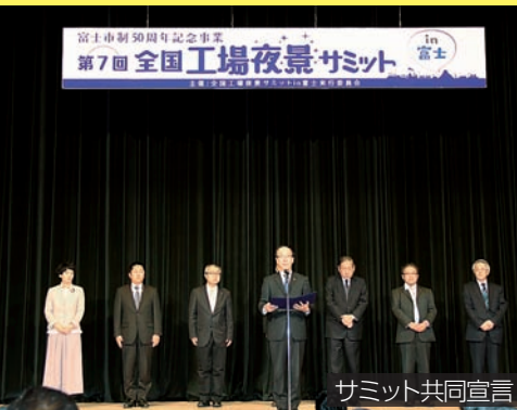
サミット共同宣言