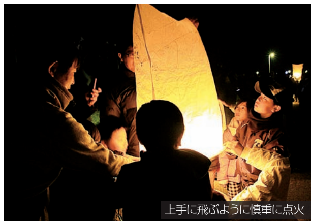
上手に飛ばすように慎重に点火