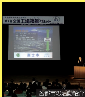
各都市の活動紹介