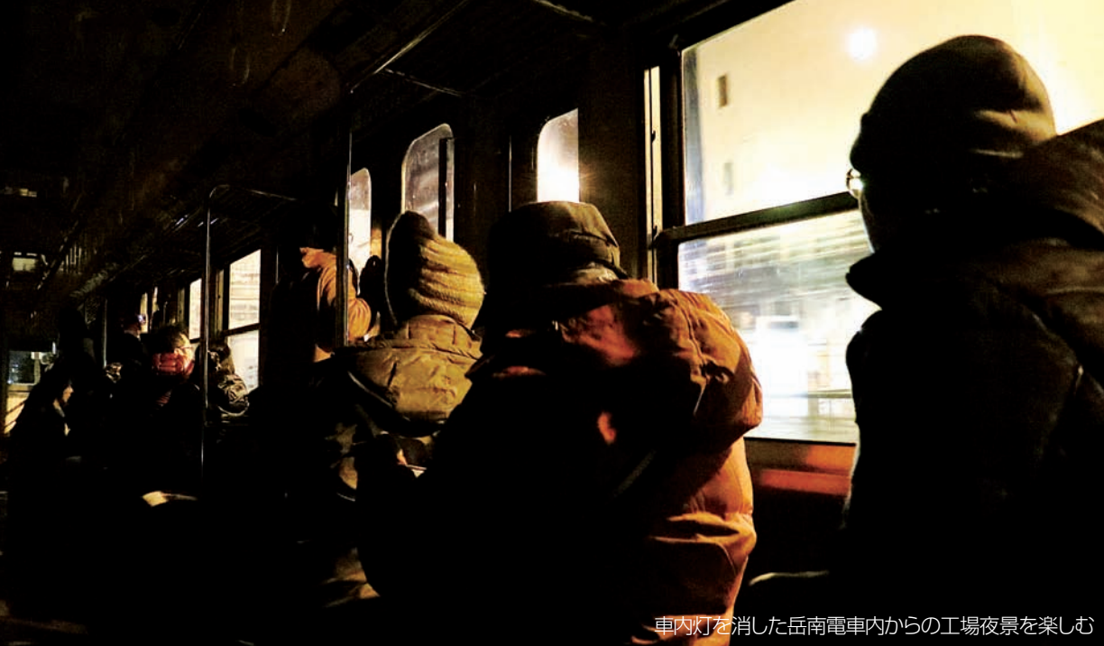
車内灯を消した岳南電車内からの工場夜景を楽しむ