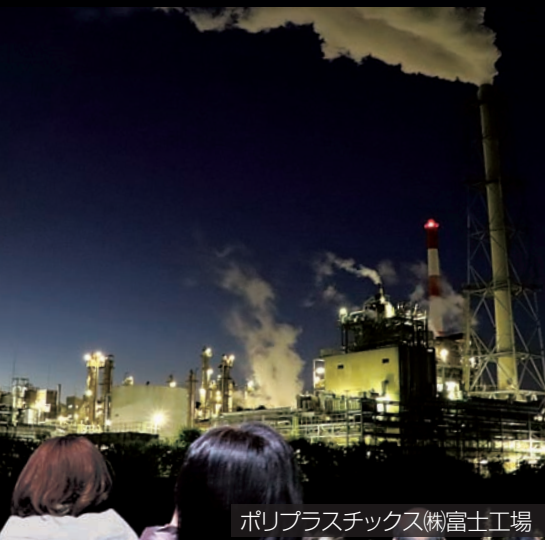
ポリプラスチック(株)富士工場