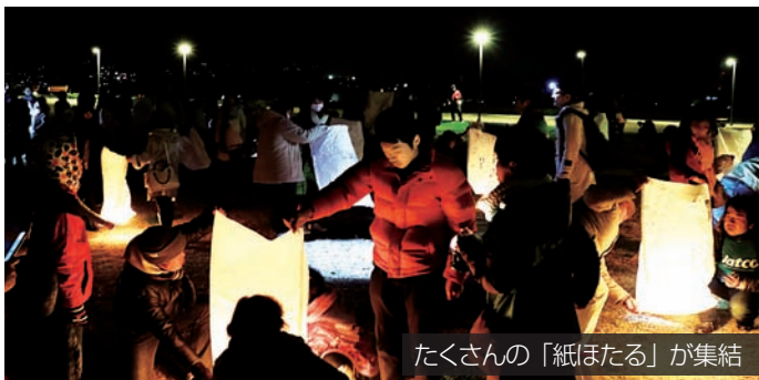
たくさんの「紙ほたる」が集結