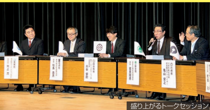
盛り上がるトークセッション