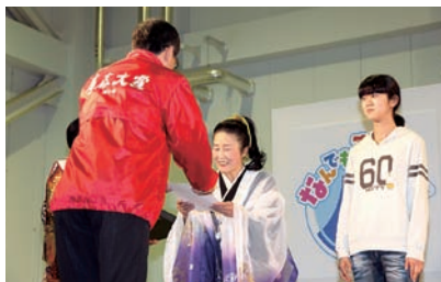
「チャレンジ認定証」交付式