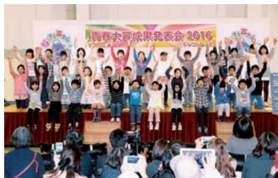
取り組みの成果発表 (神戸小学校の児童による合唱)