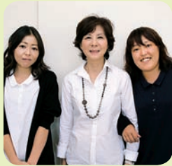
村松電機(株) 衛生委員会の皆さん (厚原)

健康推進員になったことをきっかけに始め、それからずっと続けています。もともと健康のために近所でウォーキングを行っていました。ふじさん青春マイレージで日々の結果を日記のようにチェックすることで、意識が高くなり、現在はいろいろなウォーキングコースをめぐって楽しんでます。夏場は無理せず、室内でできる筋力トレーニングに変えるなど工夫をしています。もちろん、特典も楽しみの1つです。今後は一緒にウォーキングをする仲間をふやしたいですね。