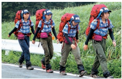
大会で体力・歩行審査に臨む選手

ムもありましたが、体力のないメンバーの荷物をほかの人が背負うなど、助け合うことで最後まで全力を出し切ることができました」と話します。「優勝がわかったときは、うれしくて涙があふれてきました。家族や先輩・先生など多くの人に支えてもらったので、優勝という形で恩返しできてよかったです。後輩には、来年の大会でも力を発揮し、連覇してほしいです」とエールを送っていました。