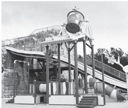
▲新たに設置された水遊具

※ストレートスライダーは改修工事が完了し、安全確保ができたため、ことしから利用を再開します。