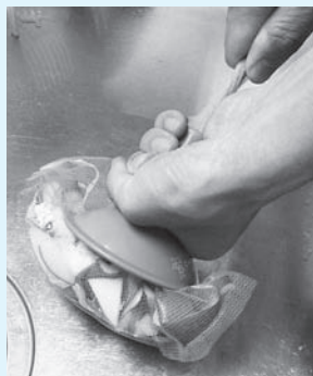
▲「水切りダイエット」を使った水切り

申込方法／7月8日（金）（土・日曜日は除く）までの8時30分～17時15分に、直接または電話で廃棄物対策課（市役所10階）へ