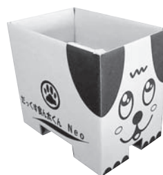
▲ダンボールコンポスト

しかし、設置場所や経費などの理由で、生ごみを自家処理することが困難な家庭もあることから、今後、より一層生ごみを削減するため、どの家庭でも簡単にできる「生ごみの水切り」の取り組みについても呼びかけていきます。