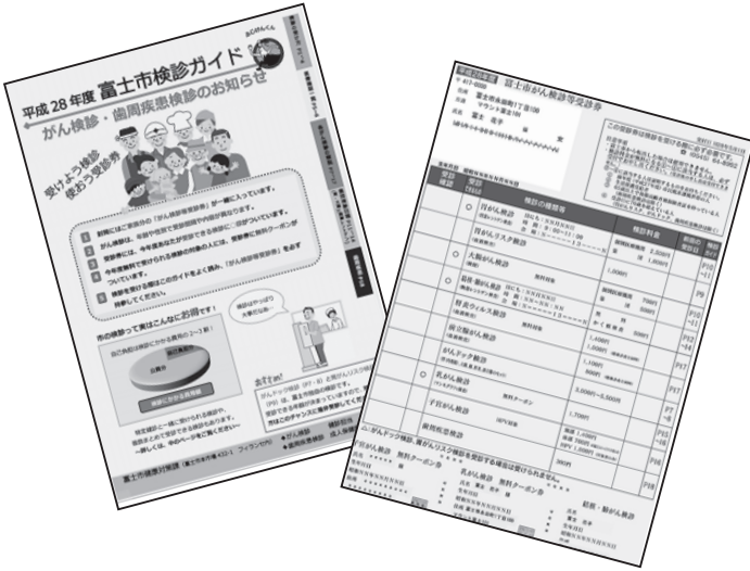
▲「検診ガイド」(左)と「受診券」 ※受診券は家族分が同封されています。