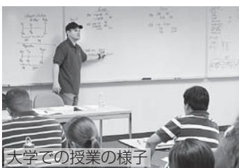
大学での授業の様子

詳しくは、 チラシ (各地区まちづくりセンターで配布)または 市ウェブサイト をご覧ください。