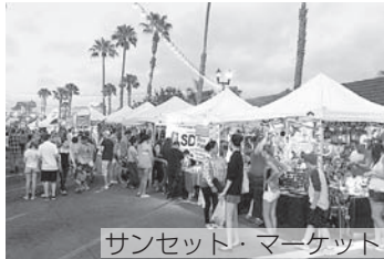
サンセット・マーケット