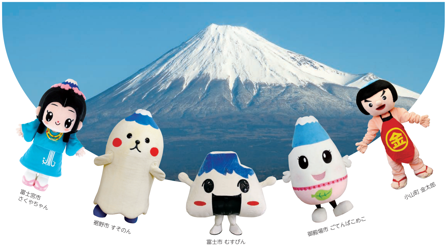
富士宮市 さくやちゃん