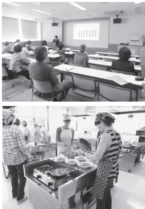
▲学習会、調理実習の様子