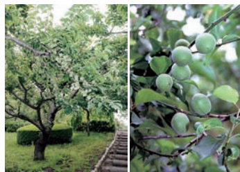
岩本山公園内の梅の木

255キログラムの梅の実が収穫されました。収穫後、利用されない実はほとんどありません。