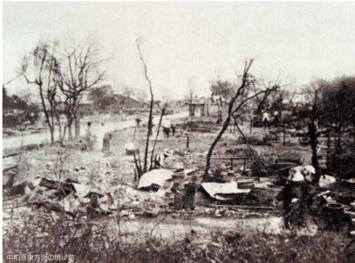
中柏原東方面の焼け跡

「富士の災害史」は、過去に市域が見舞われた災害を皆さんに理解してもらい、防災意識を高めていただくため、平成25年3月に発行されました。広報ふじでは、定期的に抜粋して掲載しています。