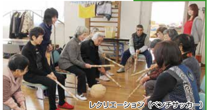
レクリエーション (ペンチサッカー)