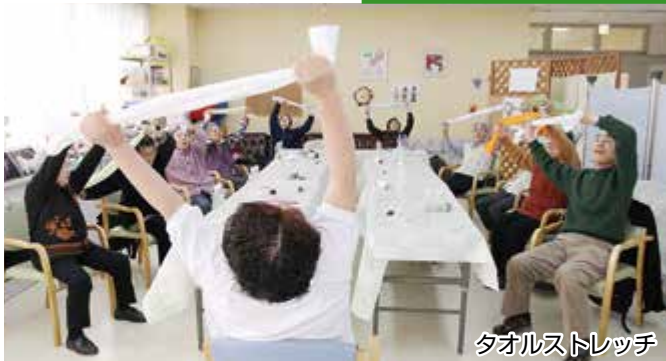
タオルストレッチ