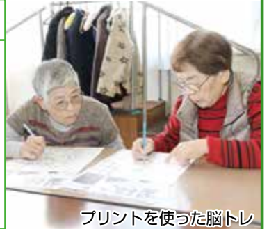
プリントを使った脳トレ

生活相談員さんに誘われたのをきっかけに利用しています。ここで知り合いと再会し、新しい仲間もできました。みんなと世間話をするのが楽しいです。気楽にいられるのが何よりですね。