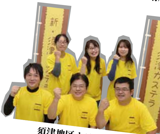
須津地区カステラ会

各イベントでの出店などにより、「新・須津カステラ」を地域に広め、地区活性化に貢献します。