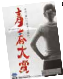
▲青春大賞ポスター