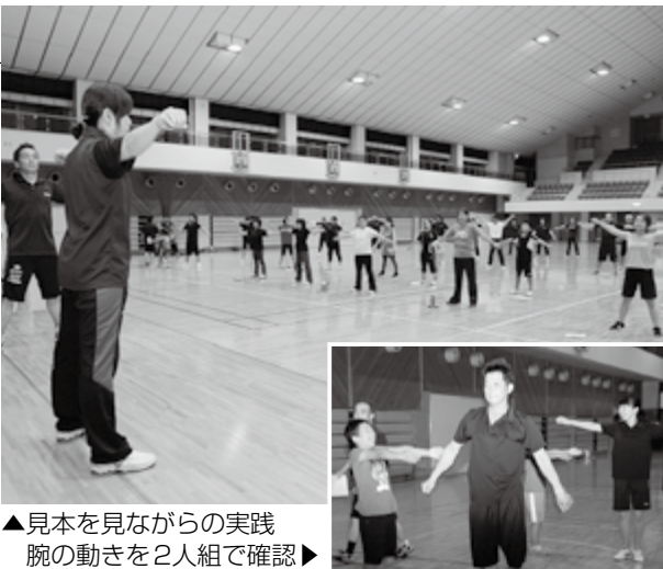
▲見本を見ながらの実践 腕の動きを2人組で確認▶

講習には、スポーツ団体のリーダーや小学生など、22人が参加。スポーツ推進委員の見本の動きを見ながら、動作一つ一つを丁寧に行いました。腕を回す運動では、腕の動かし方を2人組で確認し合う場面もあり、参加者は和気あいあいとした雰囲気の中で、第一・二体操の正しい動きを学びました。