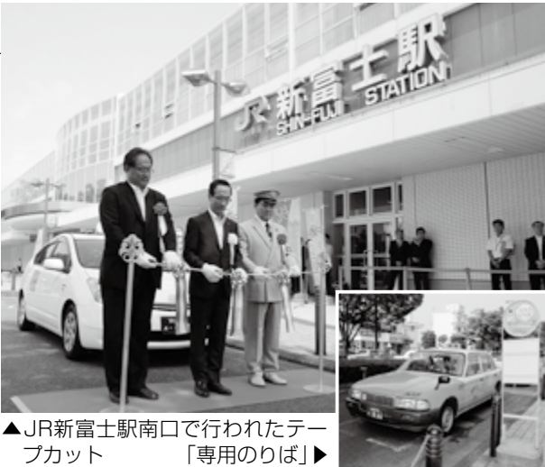
▲JR新富士駅南口で行われたテープカット 「専用のりば」▶

ワンコインタクシーは、9月末まで、毎日6時〜23時30分に運行します。JR新富士駅とJR富士駅南口の南口にある「専用のりば」から利用できます。