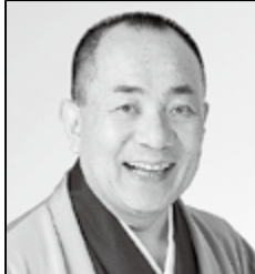
三遊亭小遊三 (落語家)

とき/上記をごらんください 19時〜20時30分(第1回は18 時45分) 計7回 ところ/ロゼシアター中ホール 対象/富士市・富士宮市に在 住・在学・在勤の15歳以上の 人(中学生は除く) 定員/700人(応募者多数 の場合抽せん) ※定員に満たないときは、各回ご とに入場券を販売する場合あり。 受講料/4000円 申し込み/8月4〜14日に、市 ウェブサイト・モバイルサイ トで電子申請するか、直接左 記受付場所へ 受付場所/①各地区まちづくり センター 9〜21時(土・日 曜日は除く) ②富士市役所7階社会教育課、 富士宮市役所6階社会教育課 9〜17時(土・日曜日は除く) ※二人一組でも申し込みできま す。