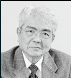
屋山太郎 (政治評論家)