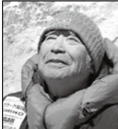
三浦雄一郎 (プロスキーヤー)