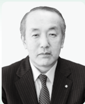
仁藤 哲 副市長

副市長は、市長の補佐、職員の担任する事務の監督、市長の職務代理などの職務に加え、政策の執行に当たります。