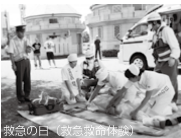
救急の日（救急救命体験）

★募集要項及び過去問題の送付を希望する人は、市立看護専門学校へお問い合わせください。